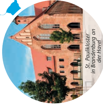
St. Paulikloster in Brandenburg an der Havel

Der über 850 Jahre alte Dom, eines der geschichtsträchtigsten Bauwerke der Region, gilt als die Wiege und Mutterkirche der Mark Brandenburg. www.dom-brandenburg.de