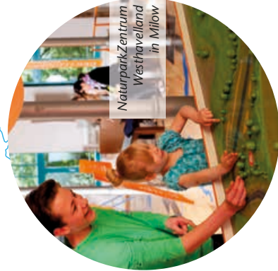
NaturparkZentrum Westhavelland in Milow