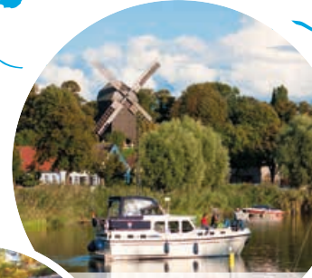
Inselstadt Werder (Havel)