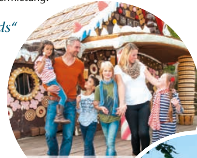
Filmpark Babelsberg in Potsdam

Kinder-Spielparadies zum Toben und Klettern für die Kleinen – und das bei jedem Wetter. www.meer-for-kids.de