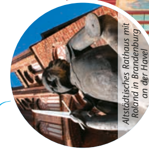
Alostädtisches Rathaus mit Roland in Brandenburg an der Havel