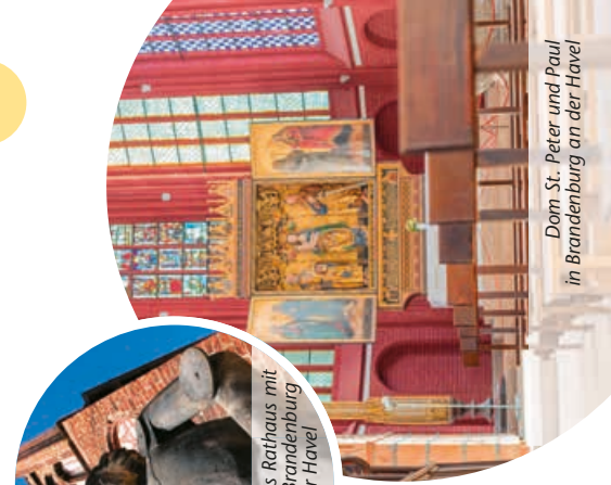
Dom St. Peter und Paul in Brandenburg an der Havel