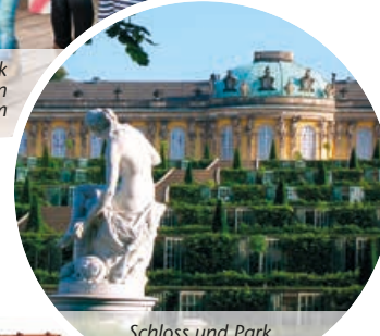
Schloss und Park Sanssouci