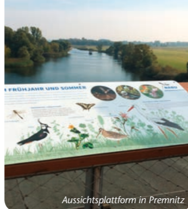
Aussichtsplattform in Premnitz

Öffnungszeiten & Preise 1./3./5. So im Mär/Sept–Nov 14–17 Uhr, Apr–Aug 14–18 Uhr, zusätzl. Juli/Aug Do 15–18 Uhr, zur Baumbüte tgl. 14–18 Uhr · Eintritt 2 EUR