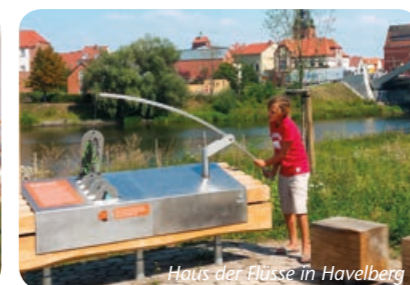
Haus der Flüsse in Havelberg