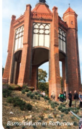
Bismarckturm in Rathenow